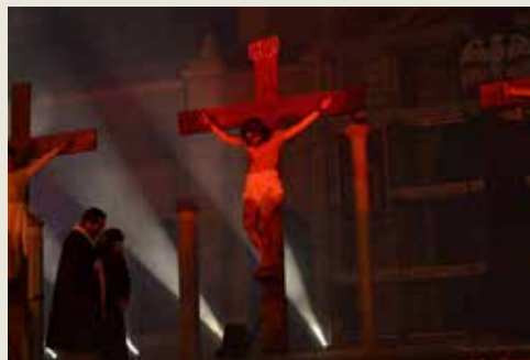
Una immagine della Passione di Nettuno