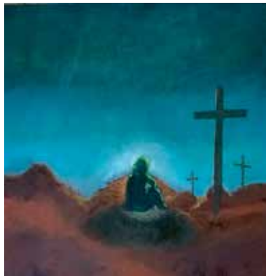
L'opera "Malinconica speranza" di Giuliana Nadalutti creata per l'edizione 2025 della Via Crucis di Ciconico

Gesù, nella sua infinita sapienza e misericordia, vede oltre. Egli riconosce in ogni uomo il contrasto tra ombra e luce, e non condanna, ma chiama alla consapevolezza. L'ombra non è un marchio di perdizione, ma una condizione umana che solo la sua luce può redimere.